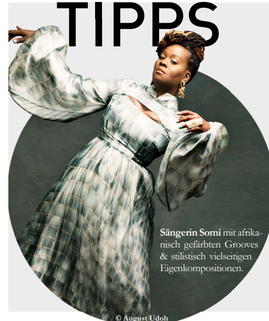
Sängerin Somali mit afrikanisch gefärbten Grooves & stilistisch vielseitigen Eigenkompositionen.