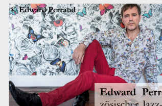
Edward Perraud: französischer Jazz-Schlagzeuger und Songschreiber.

Herbstliche Klangfarben: Jazz & The City, 16. – 20. Oktober, sich munter durch 70 Konzerte zwischen Kirchen, Galerien, Konzerthäusern, Weinkellern und Bars der Stadt treiben lassen – und das zum Nulltarif! Auf der Suche nach neuen Klängen trifft man hier auf Gleichgesinnte und genießt eine lockere und für Salzburg ganz ungewöhnliche Festival-Atmosphäre, den guten Wein und vor allem gute Musik zwischen Jazz, Worldmusic und elektronischen Clubsounds. Nicht umsonst wird „Jazz & The City“ in Insider-Kreisen als Österreichs lässigstes Jazzfestival gehandelt. Unbedingt die Festival-App downloaden.